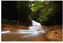
Air Terjun Bantimurung

Bantimurung adalah primadona wisata alam Sulawesi Selatan. Sebagai objek wisata andalan, Bantimurung menyodorkan beragam atraksi wisata menarik. Air terjun yang mengalir deras, aliran sungai dengan tepian berbatu yang diapit kokohnya tebing terjal, serta sejuknya hawa menjadi suguhan yang mengundang banyak pengunjung. Bantimurung pun dikenal hingga ke mancanegara sebagai “The Kingdom of Butterfly” . Sebuah julukan yang diberikan karena keanekaragaman dan kelimpahan kupu-kupunya ini pulalah yang mendasari Taman Nasional (TN) Bantimurung Bulusaraung mengembangkan penangkaran kupu-kupu yang diusung dalam konsep Taman Kupu-kupu. Selain untuk kepentingan konservasi jenis, Taman Kupu-kupu ini berfungsi sebagai wahana pendidikan konservasi bagi masyarakat umum.