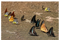
Atraksi Kupu-kupu

Bantimurung adalah primadona wisata alam Sulawesi Selatan. Sebagai objek wisata andalan, Bantimurung menyodorkan beragam atraksi wisata menarik. Air terjun yang mengalir deras, aliran sungai dengan tepian berbatu yang diapit kokohnya tebing terjal, serta sejuknya hawa menjadi suguhan yang mengundang banyak pengunjung. Bantimurung pun dikenal hingga ke mancanegara sebagai “The Kingdom of Butterfly” . Sebuah julukan yang diberikan karena keanekaragaman dan kelimpahan kupu-kupunya ini pulalah yang mendasari Taman Nasional (TN) Bantimurung Bulusaraung mengembangkan penangkaran kupu-kupu yang diusung dalam konsep Taman Kupu-kupu. Selain untuk kepentingan konservasi jenis, Taman Kupu-kupu ini berfungsi sebagai wahana pendidikan konservasi bagi masyarakat umum.